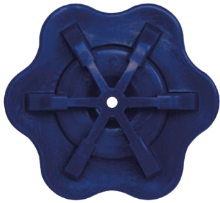
Rociador de 7 agujeros