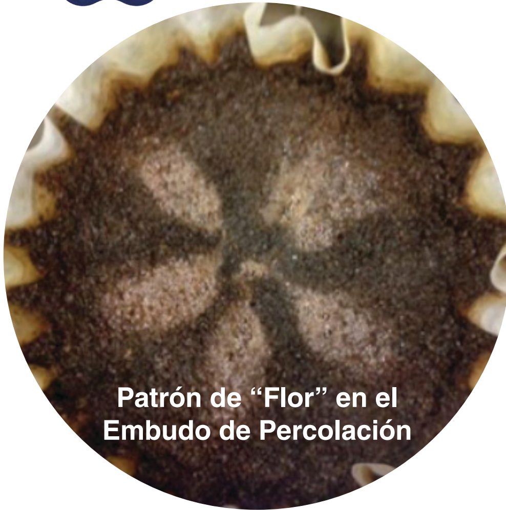
Patrón de "Flor" en el Embudo de Percolación